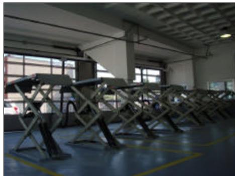
Foto 2: “Reciente Instalación de Elevadores Tijera de última generación”