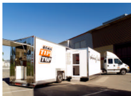
Foto 2: “El nuevo Centro de Formación móvil, al servicio del sector.”

“Vicente Soria (Velyen) y Enric Olmos (Rema Tip Top Ibérica) firmando el acuerdo de Alianza Estratégica entre las dos empresas”.