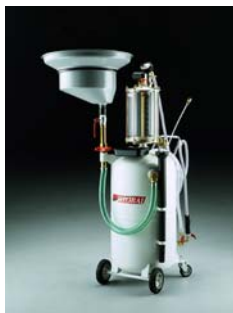
Aspirador Recogedor Ref: 5010190