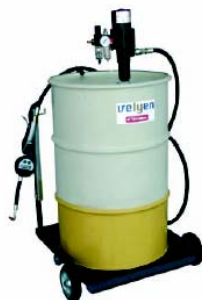
Distribuidor Móvil Aceite Ref: 4LM0010