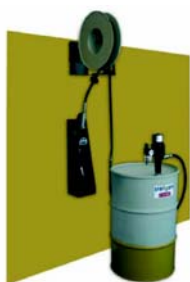
Distribuidor Móvil Aceite Ref: 4LM0030